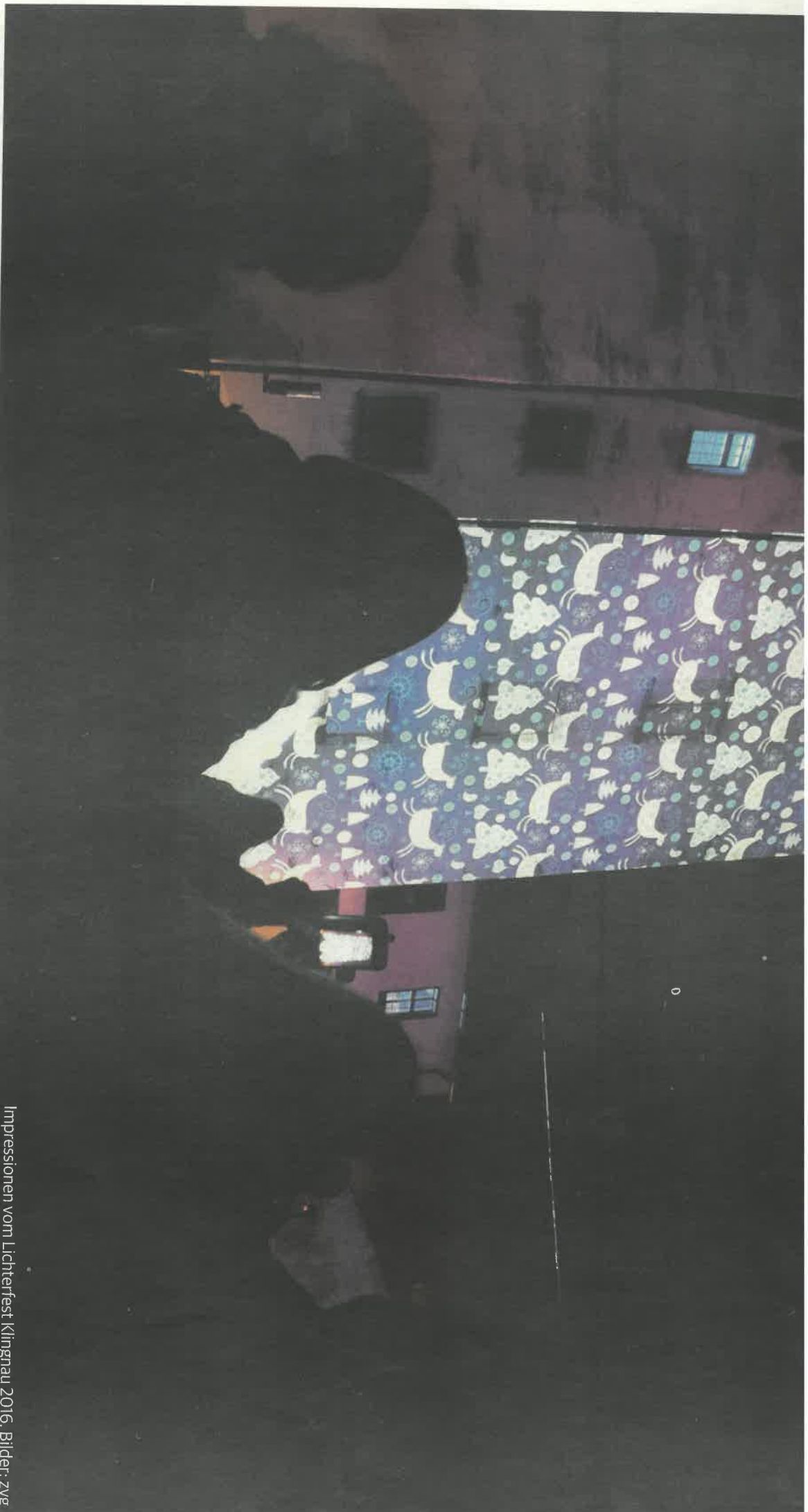
Impressionen vom Lichterfest Klingnau 2016.