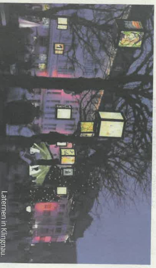
Laternen in Klingnau.