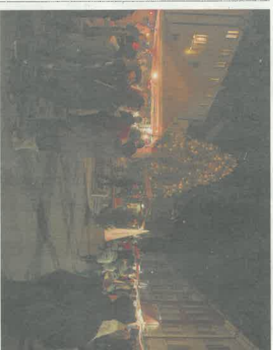
Weihnachtsmarkt Klingnau.

Der Gebenstorfer Weihnachtsmarkt findet immer am 1. Advents-