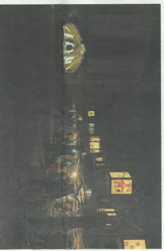
Weihnachtsmarkt Klingnau.

Der Weihnachtsmarkt der Sinne in Zofingen gilt als «Geheimtipp» unter den Weihnachtsmärkten. Das Verweilen, Staunen und Flanieren, umhüllt von weihnachtlichen Düften und Lichterglanz, fasziniert Gross und Klein.